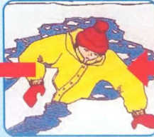
Забросить на лёд ногу, откатиться от полыньи