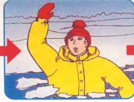
Не паниковать, позвать на помощь