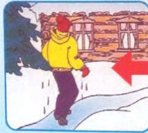
Не отдыхая, бежать к близкому жилью