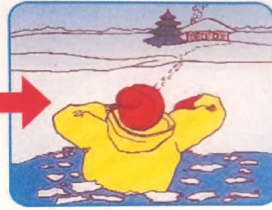
Выбираться в сторону, с которой произошло падение