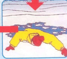
Наползать на лёд, раскинув руки в стороны