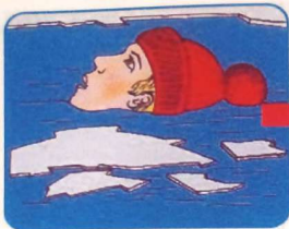
Не погружаться в воду с головой