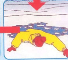
Наползть на лёд, раскинув руки в стороны